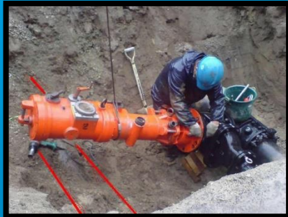
リクライニング仕切弁に穿孔機設置中