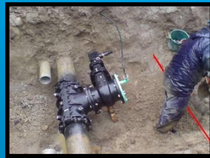
リクライニング仕切弁斜め設置完了