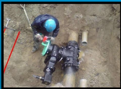
水圧テスト準備中