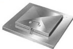
通気口付 DCJ-12 型 [スカート式]