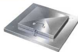
標準タイプ DCJ-S2 型 [スカート式]