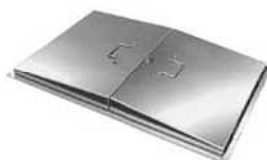
大型・両開き DCJ-D 型 [ガasket式]