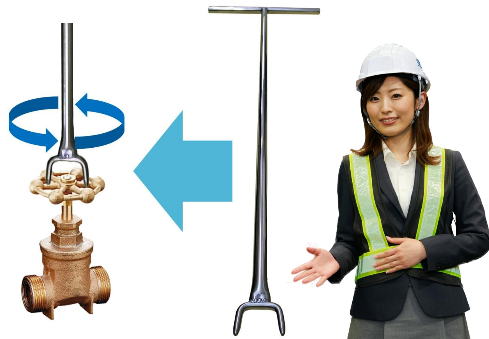
図（イメージ） [図：U型のバルブキーを丸ハンドルに差し込み、回す様子] ※ 図はあくまでイメージです。実際の形状は製品によって異なります。

この説明書は一般的な操作手順を説明したものです。ご使用の給水栓（仕切弁等）によっては、操作方法が異なる場合があります。必ず、取扱説明書をよく読んでから作業を行ってください。ご不明な点がある場合は、千代田工業㈱にご相談ください。